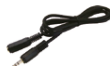
Prolunga per smerigliatrice [PE-100]

Lunghezza.....1 m Prolunga per collegare la centralina al cavo della smerigliatrice. *Non si possono collegare più prolunghie.