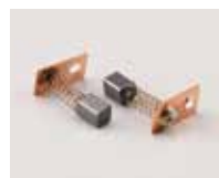
Spazzole di ricambio [KE-610]