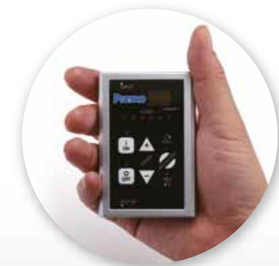
Centralina Digitale Ultraleggera 50g